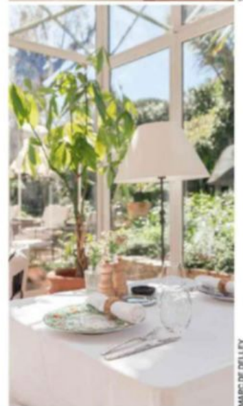
MARC DE DELLEY