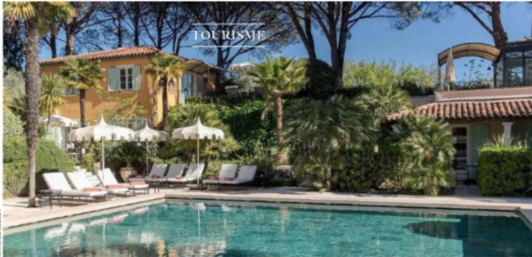
MARC DE DELLEY

OASIS L'hôtel est niché dans un écrin de verdure, à l'écart de l'agitation tropézienne, mais proche de tout ce qui se passe.